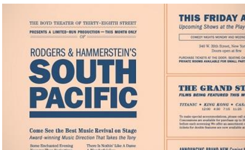
Рис. 1. Современное применение шрифта Franklin Gothic

Поскольку в Америке не было производства литейных форм, Франклин изобрел свою собственную. Он стал первым в Америке, кто изготовил отливную форму. Один из наиболее популярных современных типографских шрифтов, известных под названием Franklin Gothic, который часто используют для газетных заголовков, был назван в честь него в 1902 году.