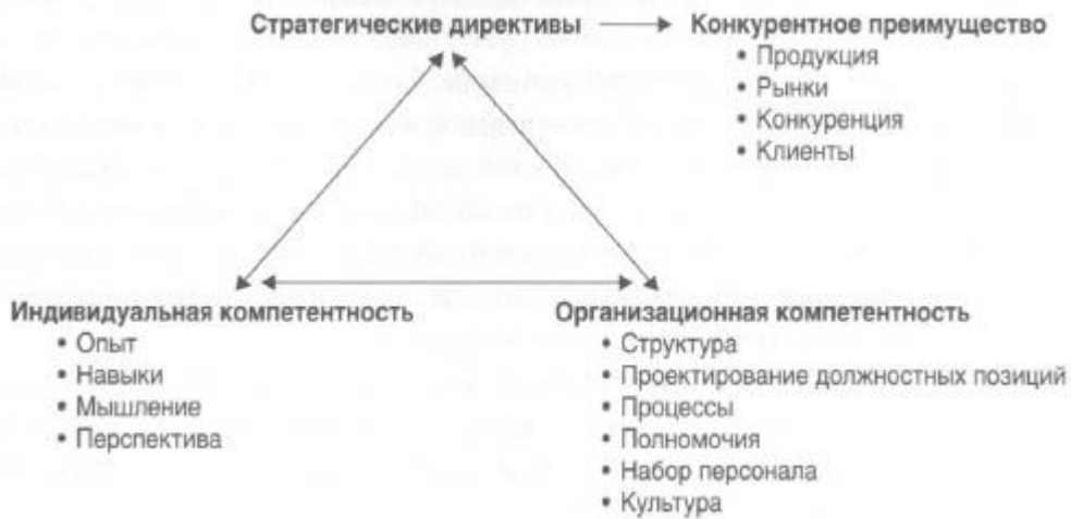
Рис. 3. Структурированная схема работ (равносторонний треугольник)