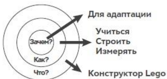
Рис. 2. Золотой круг бережливого стартапа

Дизайн поможет любой компании быстро переключиться с провала на процесс обучения (рис. 2). Учиться, строить и измерять — тот самый процесс, который осуществляют большинство сегодняшних стартапов и сердцевина метода, который Эрик Рис и другие авторы называют Методом бережливого стартапа .