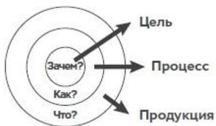
Рис. 1. «Золотой круг»

Саймон Синек с помощью простой модели объясняет, как успех компании и отдельных людей связан с вопросами «Что?», «Как?» и «Зачем?». Выдающиеся руководители или компании, размышляя, действуя и устанавливая коммуникацию, начинают с вопроса «Зачем?». Мантра Синека: «Люди не покупают то, что вы производите, они покупают то, зачем вы это делаете» (рис. 1).