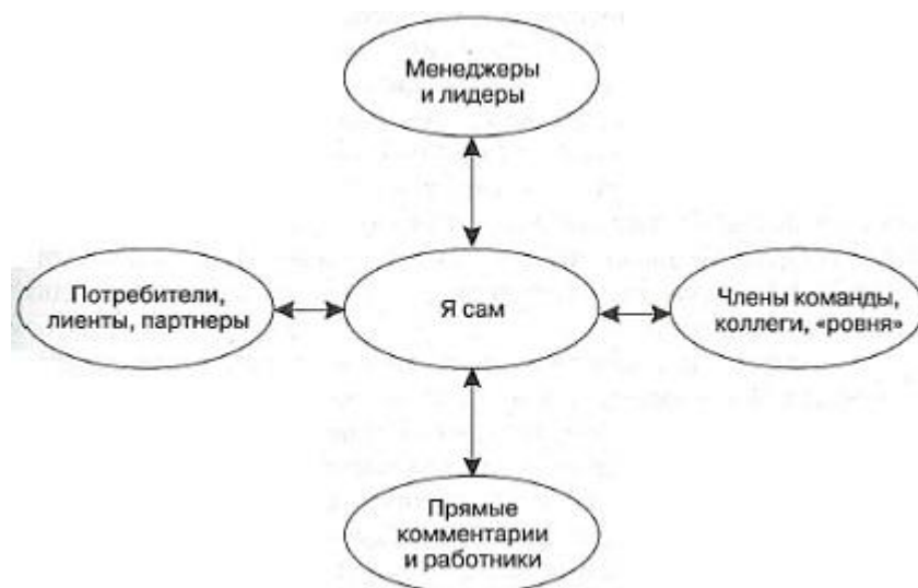
Рис. 6. Оценка 360°

Эффективной может быть методика круговой оценки (рис. 6), которая предлагает, как бы четырехмерный мгновенный снимок уровня деятельности отдельного сотрудника или команды. На основе этого снимка можно провести анализ расхождения информационного содержания данных, направляемых из разных источников, обсудив эти расхождения с отдельными сотрудниками и командами в рамках открытого процесса, возглавляемого координаторами команды или отделом кадров (подробнее см. Уильям Бирли, Татьяна Козуб. Оценка 360° ).