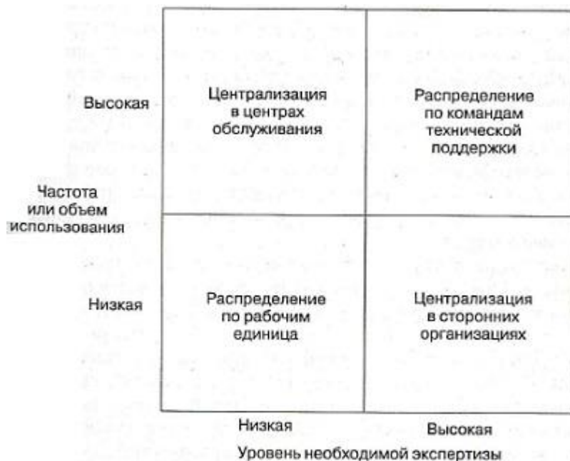
Рис. 3. Размещение функций

Когда организационные культуры, отдельные сотрудники с различным опытом или команды с узкой специализацией сливаются в более крупные подразделения, можно рассчитывать на пять возможных исходов: