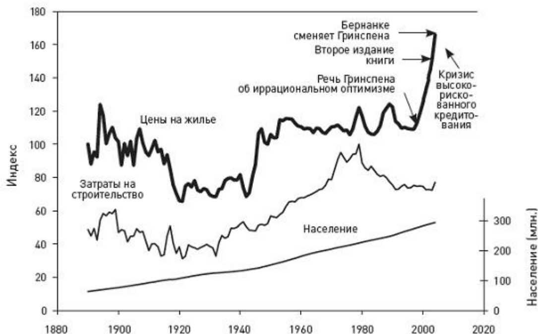
Рис. 3. Цены на жилье, затраты на строительство и население США в 1890–2009 гг. Жирная сплошная линия (левая шкала): реальный (скорректированный на инфляцию) индекс цен на жилье в США (1890 г. = 100), тонкая линия (левая шкала): реальный индекс затрат на строительство (1979 г. = 100); тонкая линия (правая шкала): население США в млн. человек

Те же психологические факторы, под воздействием которых долгие годы находился фондовый рынок, могут влиять и на другие рынки. Например, на рынке недвижимости, и особенно частных домов (рис. 3).