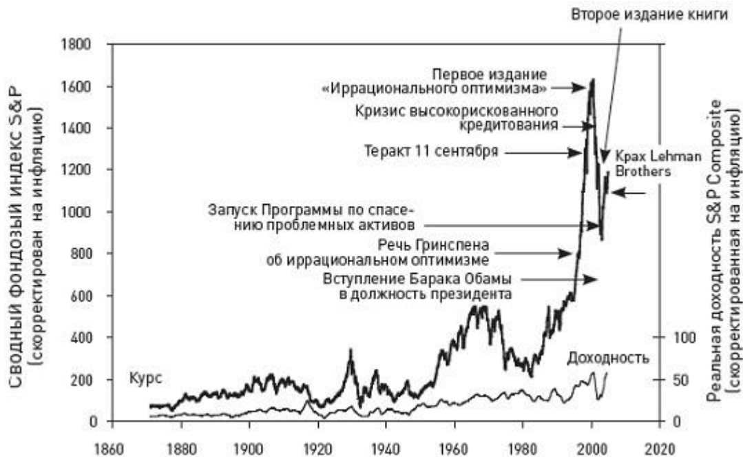
Рис. 1. Курс и доходность акций, 1871–2009 гг.

Из рис. 1 видно, что никогда прежде в истории фондового рынка курс акций не вел себя так, как это было в 2000 г. Конечно, был известный всем разгон рынка в 1920-е с последующим крахом в 1929 г. На рис. 1 этот бум показан в виде остроугольной фигуры изменения курса. Если же сделать поправку на меньший объем рынка того времени, то можно признать, что события 1920-х гг. в какой-то степени напоминают недавний рост фондового рынка, но это единственный эпизод за всю историю, с которым можно сравнить последний бум.