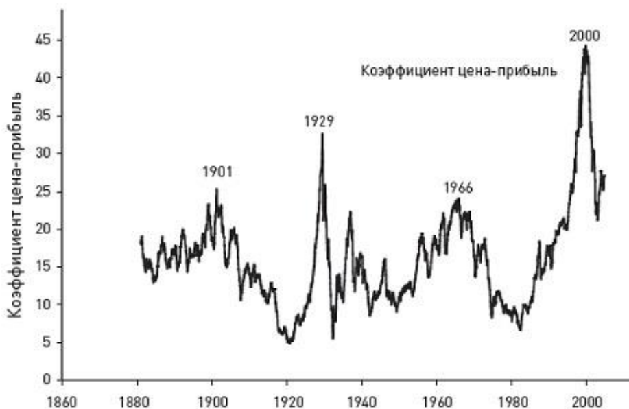
Рис. 2. Коэффициент цена-прибыль. Числитель: реальный (скорректированный на инфляцию) сводный фондовый индекс S&P за месяц. Знаменатель: скользящее среднее за предыдущие десять лет реальной доходности S&P Composite

Поскольку рост курса акций существенно превышал рост доходности коэффициент цена-прибыль также взлетел до небес (рис. 2). Коэффициент цена-прибыль показывает взаимосвязь между рыночным курсом акций и реальной способностью корпораций получать прибыль.