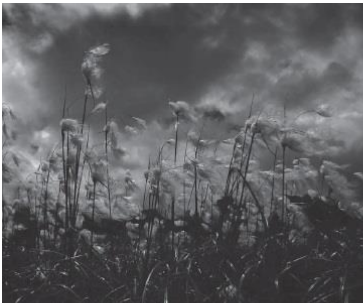
Рис. 5. Покрытый росой альпийский хлопок на леднике Алеч в Швейцарии