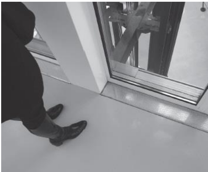
Рис. 7. Экстремальное кадрирование

Каждый фотограф знаком с очарованием съемки симметричных объектов (рис. 8). Но будьте осторожны! Безупречная симметрия, изображение за изображением, может быстро наскучить. Фотографии с асимметричными деталями гораздо более интересны. Асимметрия бросает вызов балансу и равновесию. Без нее не обойтись, особенно если мы хотим придать весомости выбранным объектам (рис. 9).