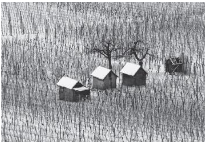
Рис. 14. Ряды лоз в районе Бадишен Бергштрассе (Германия) своеобразно контрастируют со строениями и изящными деревьями

Идентификация и выделение текстур на фоне обилия оптических образов — одна из самых приятных задач для фотографа. Мы часто не осознаем красоту текстуры или узора, пока не посмотрим в видоискатель, на экран фотокамеры или позднее — на экран монитора (рис. 14).