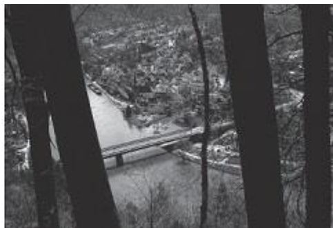
Рис. 6. Препятствия в поле зрения

Особенно ценный совет для студентов, приступающих к учебе: в портфолио должно быть единообразие. Выберите какую-нибудь сферу или тему, чтобы доказать свое умение сосредотачиваться на чем-то одном длительное время.