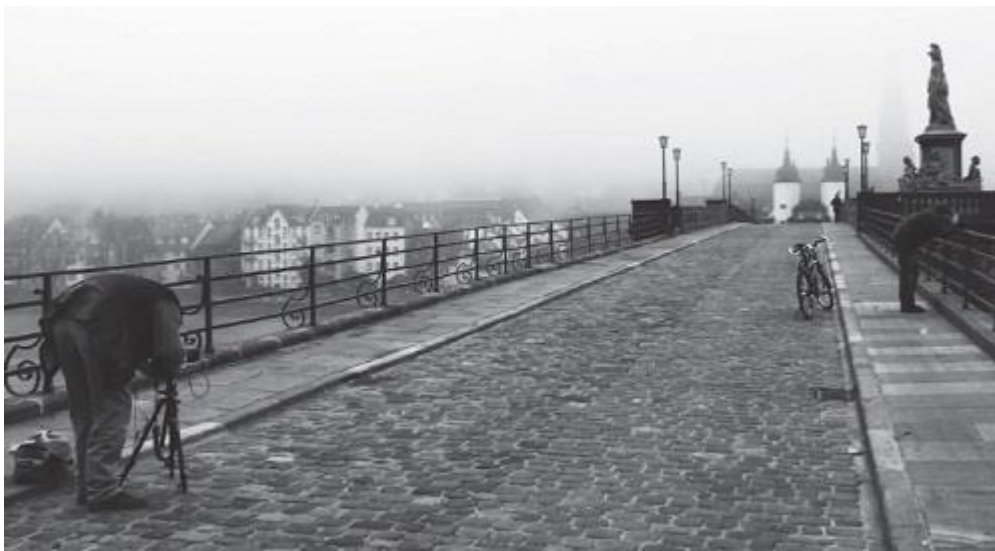
Рис. 4. Перспектива, смещенная от центра

Для имитации глубины пространства на плоскости существует множество методов. Следующее фото интересно не только смещенной от центра перспективой, но и тем, что ключевые точки в изображении ведут зрителя от одного фотографа к другому, а затем к пешеходу в верхнем углу (рис. 4).