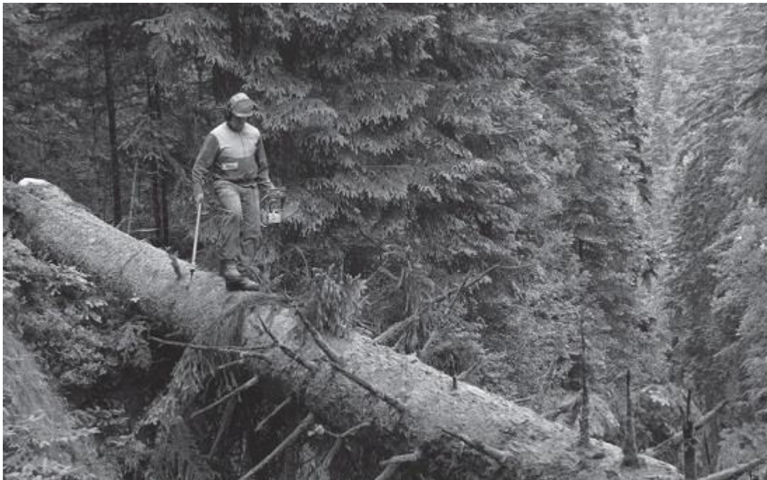
Рис. 3. Нисходящая диагональ создает негативную реакцию