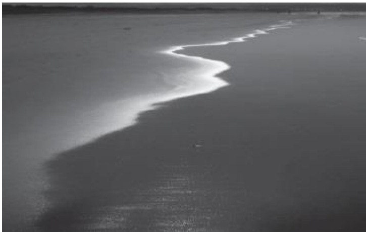
Рис. 2. Диагональная линия границы между песком и водой

Диагональные линии при компоновке фотографий можно использовать для создания резкого контраста между изображением и прямоугольной формой изображения (рис. 2). Постарайтесь избегать выравнивания видимого контура объекта параллельно вертикальной и горизонтальной границам изображения. Например, композиция фотографии, изображающей дом с углового ракурса, намного более привлекательна, чем эта же фотография, сделанная «в лоб». Нередко стоит изменить точку съемки, чтобы наиболее важные контуры объекта шли под углом к краям изображения.