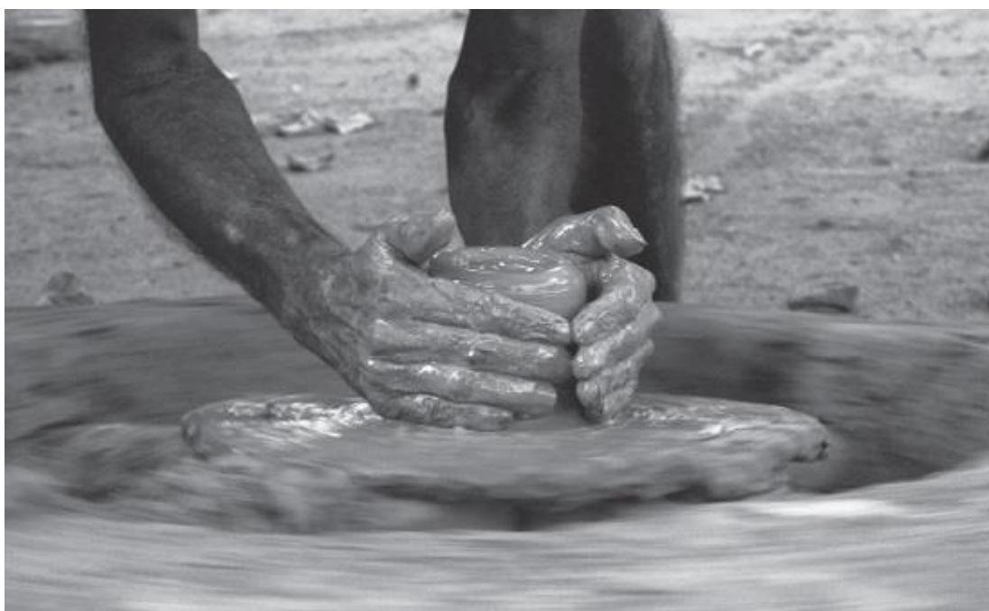
Рис. 13. Размытие придает гармонию, подчеркивая крепость рук гончара

Резкая фотография не станет идеальной только из-за своей резкости, как и размытое фото произведением искусства только из-за искажения. Другими словами, размытие — прекрасный инструмент, если поддерживает сюжет изображения. Фотография гончара — отличный пример (рис. 13). Чтобы придать форму сосудам на гончарном круге, необходимы крепкие руки. Таким образом, быстро вращающийся кусок глины становится гармоничным объектом. Размытие гончарного круга здесь вмещает в себя весь требуемый смысл.