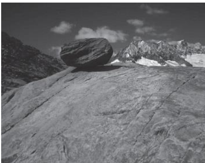
Рис. 11. Темный валун, оставленный тающим ледником Алеч на поверхности скалы, создает контраст

Сочетание противоположностей выливается в гармоничную композицию. Фотография — не весы, которым для баланса требуются чаши одинакового веса. Сделанный со вкусом снимок может быть результатом комбинации элементов, которые отличаются друг от друга по ширине, длине, форме, ориентации, текстуре, интервалам или яркости (рис. 11).