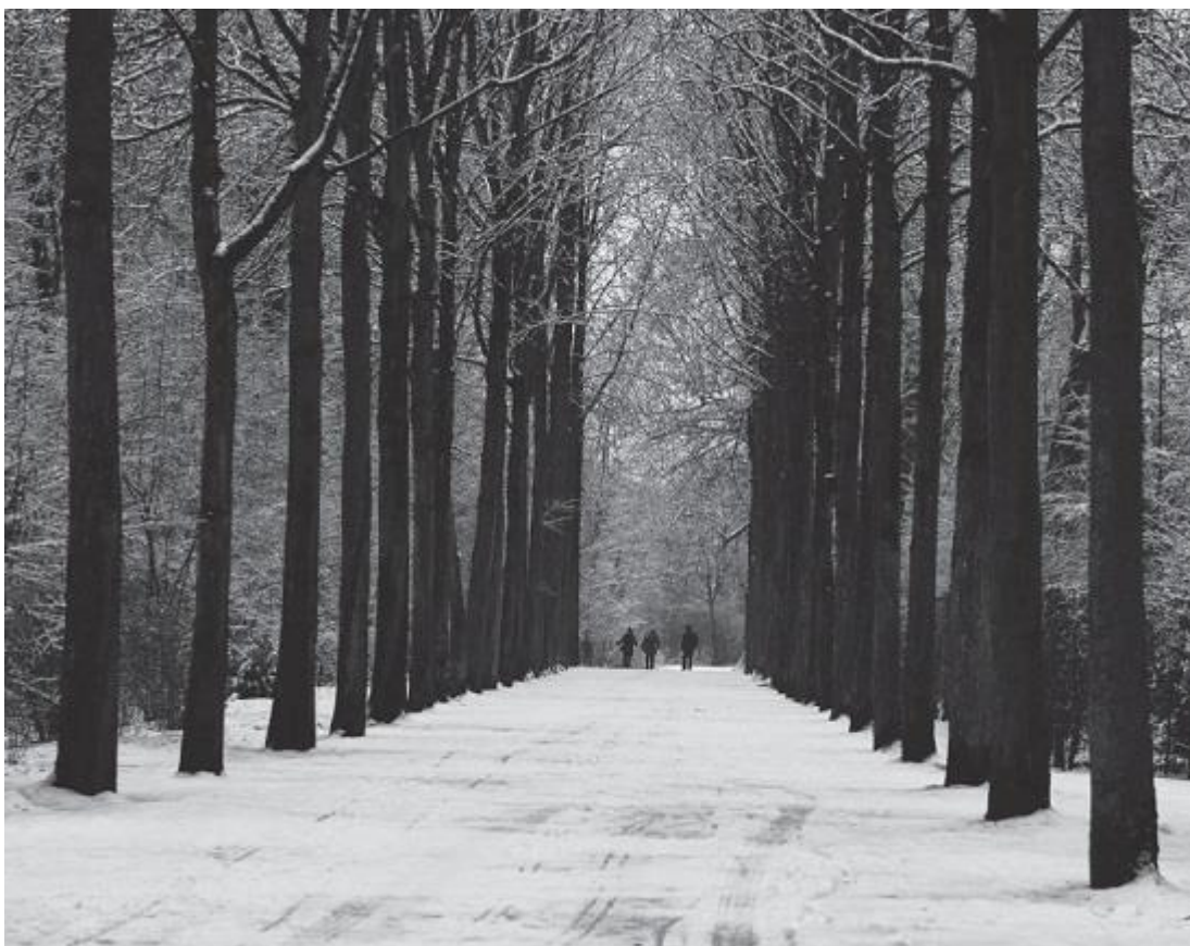
Рис. 8. Симметрия лип в саду Палатинат Шветцингенского дворца слегка смещена неровным ритмом стволов и ветвей

Каждый фотограф знаком с очарованием съемки симметричных объектов (рис. 8). Но будьте осторожны! Безупречная симметрия, изображение за изображением, может быстро наскучить. Фотографии с асимметричными деталями гораздо более интересны. Асимметрия бросает вызов балансу и равновесию. Без нее не обойтись, особенно если мы хотим придать весомости выбранным объектам (рис. 9).