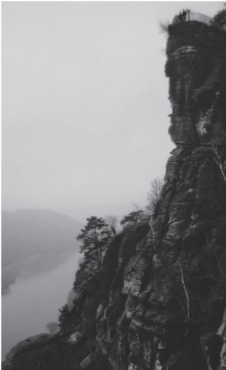
Рис. 9. Несимметричный скалистый утес в Саксонской Швейцарии отодвинут в сторону, чтобы открыть обзор вниз, на долину Эльбы

Одно из правил композиции и восприятия, заимствованное из психологии, гласит, что объект или фигура могут быть распознаны, только если идентифицируются как отличный от фона элемент. Увлеченные композицией фотографы особенно ценят объекты съемки, богатые связями фигура/фон (рис. 10).