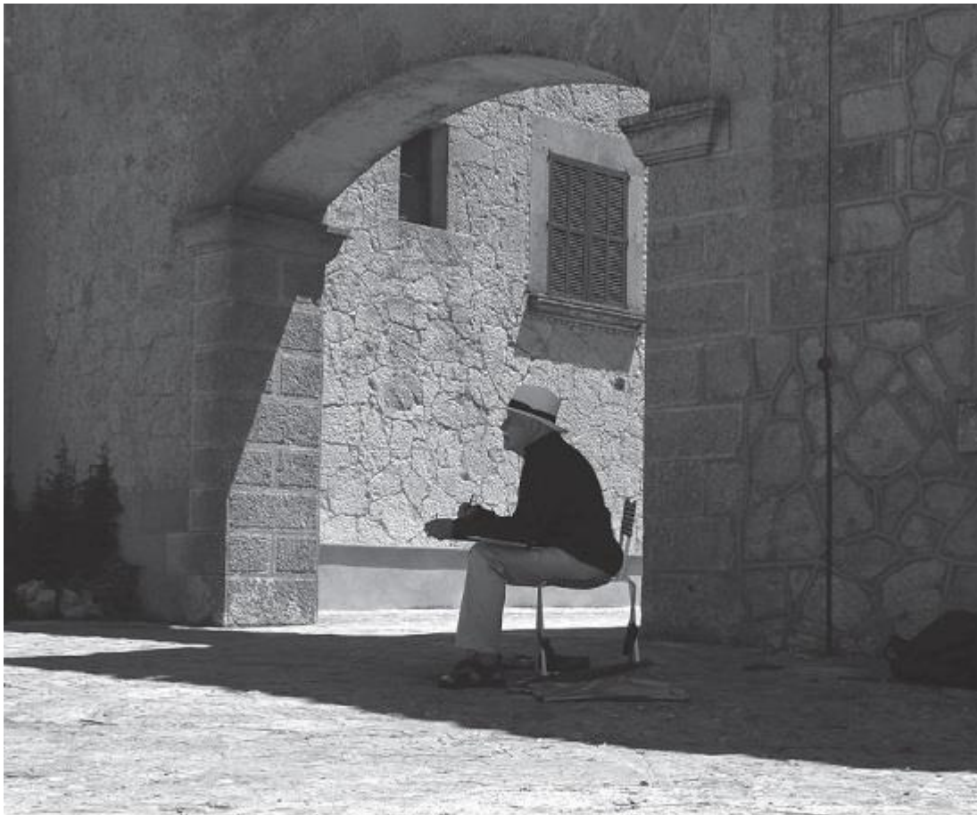
Рис. 10. Художник в монастыре на острове Майорка. Фигура художника на светлом фоне стены придает изображению узнаваемый контекст