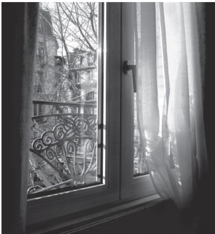
Рис. 12. Свет и тень

Все знают о положительной роли света. Лев Толстой выразил это кратко: «Все разнообразие, вся прелесть, вся красота этой жизни слагаются из тени и света» (рис. 12).