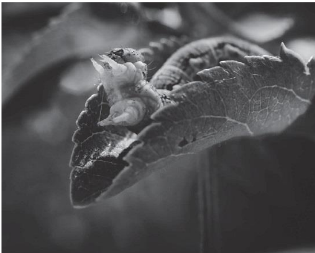
Рис. 15. Снимок с помощью макрообъектива

Проверьте, есть ли режим макросъемки у вашей фотокамеры и объектива. Если есть, используйте их возможности, чтобы исследовать мир, недоступный невооруженному глазу (рис. 15). Угрожающие позы гусениц сняты с помощью макрообъектива. Некоторые детали просматривались уже на дисплее фотокамеры, но поразительная сложность приспособленных для ползания тел личинок мотыльков стала видна только после рассмотрения изображений на компьютере.