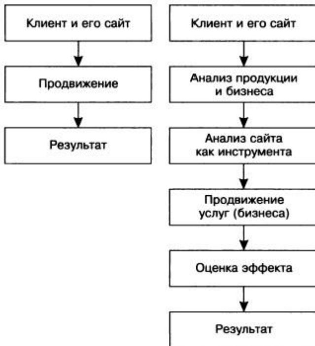
Рис. 1. Схема продвижения в существующих методах (слева) и какой она должна быть (справа)

Сайт должен быть сделан для пользователя, а не для сотрудников фирмы и генерального директора. Юзабилити — это удобство использования сайта. Рекомендую книги и статьи Якоба Нильсена и Стива Круга .