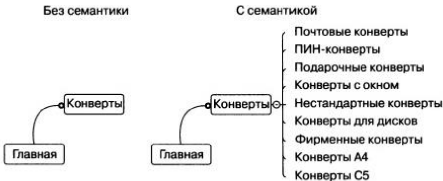
Рис. 3. Схематическая структура сайта: без семантики (это 99 % всех сайтов) и структура сайта, которая была создана после анализа и сбора семантики (это 1 % всех сайтов)