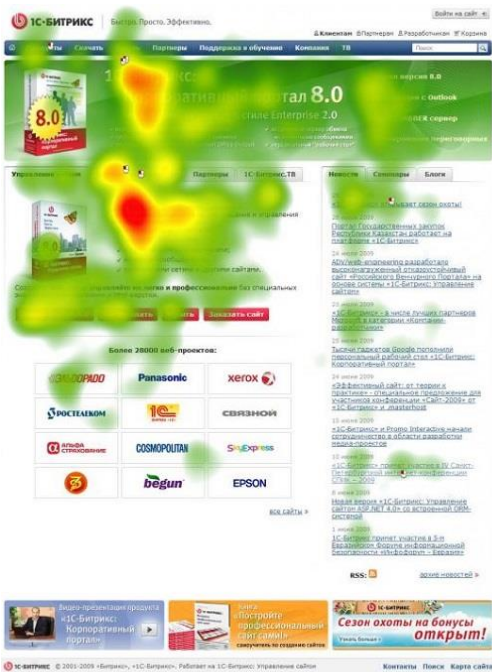
Рис. 6. Тепловая карта кликов