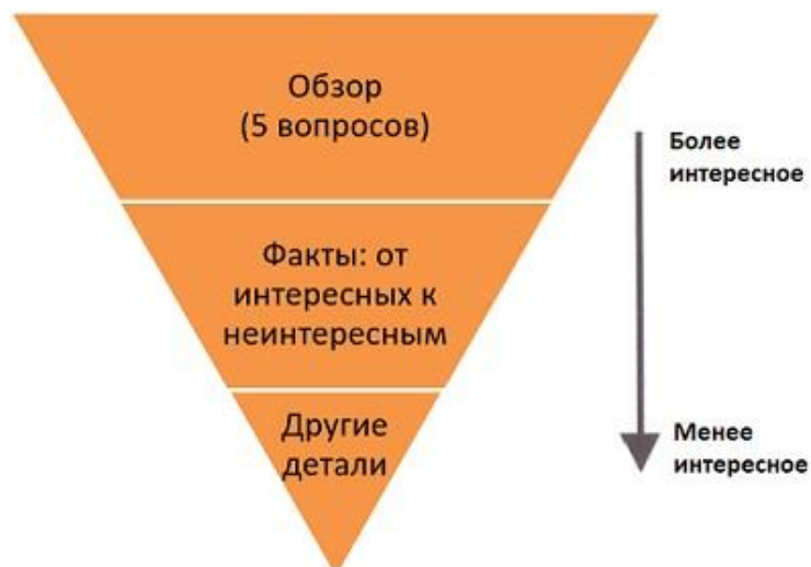
Рис. 4. Схематическое изображение концепции перевернутой пирамиды

Каждый абзац — это законченная мысль. Вы можете пользоваться концепцией перевернутой пирамиды (рис. 4; подробнее см. Барбара Минто. Принцип пирамиды Минто ).