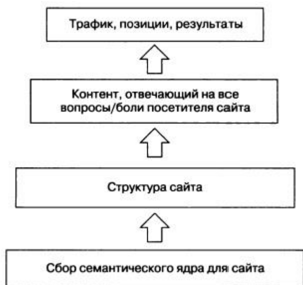
Рис. 2. Схема продвижения сайта

Прежде чем начинать процесс продвижения вашего сайта в поисковых системах, необходимо понять величину (да и наличие вообще!) спроса на те товары или услуги, которые предлагаются на вашем сайте. Спрос в поисковых системах может быть легко изучен с помощью статистики запросов поисковых систем. Процесс поиска запросов и их группировки называется составлением семантического ядра сайта . Семантическое ядро является фундаментом продвижения вашего сайта (рис. 2).