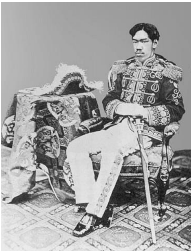
Рис. 2. Император Мэйдзи, 1873 г.

После пожара в Токио в апреле 1872 года, уничтожившего в районе Гиндза 4800 деревянных домишек, принялись строить первую в Японии улицу, все дома на которой были каменными.