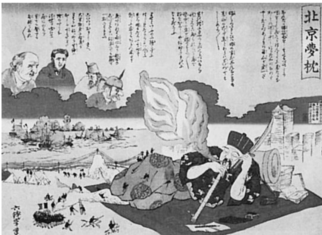
Рис. 3. Спящий Китай

Японцы были упоены реформами, модернизацией и экономическими успехами. Фукудзава Юкити говорил о том, что «цивилизованной» Японии не имеет смысла дожидаться, когда ее примеру последуют соседи, – она оторвалась настолько далеко, что ей по дороге не с азиатскими, а с европейскими странами. Фукудзава додумал эту мысль до конца – он предлагал обращаться с Китаем и Кореей точно так же, как поступает в таких случаях Запад. Он призывал подчинить эти «отсталые» страны, в которых «ничего не меняется в течение столетий».