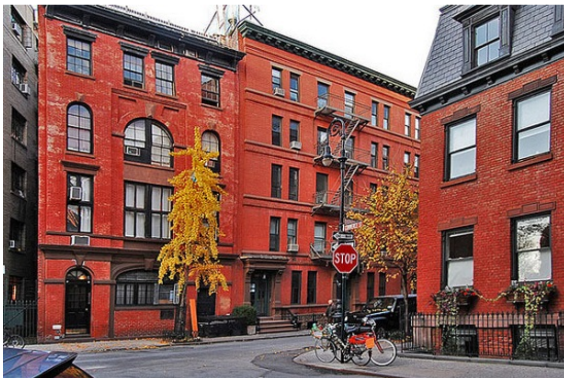
Рис. 2. Нью-Йорк. Нижний Манхэттен. Гринвич Виллидж

Глава 8. Необходимость в смешанном первичном использовании. В качестве примера экономических последствий разброса человеческой активности на протяжении дня рассмотрим Гудзон-стрит. Непрерывность тротуарного движения (которая обеспечивает уличную безопасность) покоится на экономическом фундаменте смешанного базового использования. Сотрудники лабораторий, упаковщики мяса, складские рабочие, люди, занятые на огромном количестве мелких местных предприятий, в мелких типографиях и офисах, обеспечивают рентабельность кафе, закусовых и прочих коммерческих заведений в середине дня.