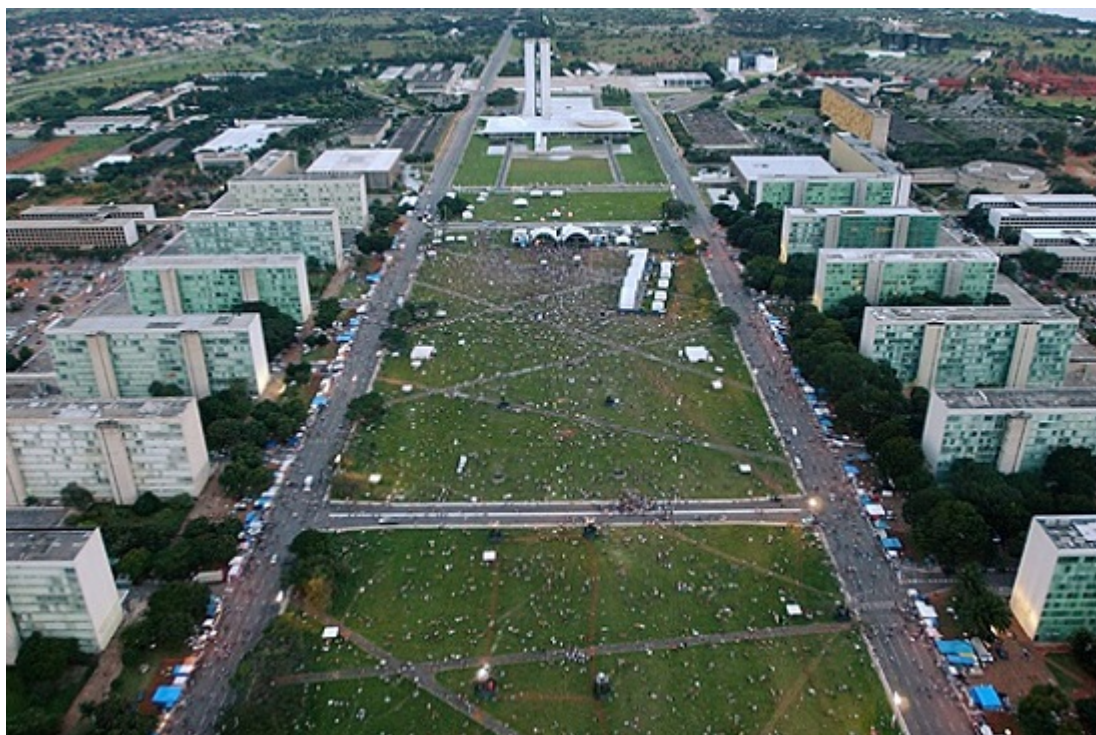
Рис. 1. Новая столица Бразилии была построена по четкому плану, в котором легко угадать градостроительные фантазии Ле Корбюзье (см. Как устроены города для чиновников от Вашингтона до Южного Судана )

Человеком, выдвинувшим наиболее эффективное предложение о том, как внедрить все это антиградостроительство был европейский архитектор Ле Корбюзье . В 1920-е годы он разработал проект Лучезарного города — города-мечты, состоящего главным образом из небоскребов, расположенных в парке. Нарисованная Ле Корбюзье картина с ее броской символикой почти неотразимо подействовала на проектировщиков, домостроителей, дизайнеров, девелоперов, займодателей и мэров. Она оказалась чрезвычайно привлекательной для «прогрессивных» уполномоченных по зонированию, которые пишут правила, рассчитанные на то, чтобы побуждать застройщиков, работающих вне единого проекта, пусть в малой мере, но отражать мечту.