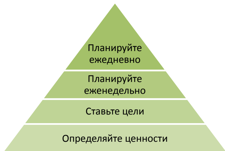
Рис. 1. Пирамида продуктивности

уточнял каждую. Модель пирамиды продуктивности (рис. 1) показывает четыре этапа, позволяющие сосредоточить время на том, что является для вас самым ценным и чего вы хотите добиться в жизни, — ваших самых приоритетных целях. Давайте подробнее рассмотрим каждый из этих этапов.