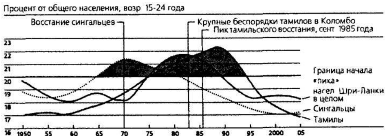
Рис. 5. Шри-Ланка: «молодежные пики» сингалезцев и тамиллов

История то затихающей, то вновь разгорающейся бойни не способна сама по себе объяснить, почему в конце двадцатого века вновь началась полоса насилия. Ведь, как указывали многие, сербы, хорваты и мусульмане десятилетиями спокойно уживались вместе в Югославии. Одним из факторов стали изменения в демографическом балансе. Численный рост одной группы порождает политическое, экономическое и социальное давление на другие группы. Крушение в начале 1970-х годов тридцатилетнего конституционного порядка в Ливане в значительной мере стало результатом резкого прироста шиитского населения относительно христиан-маронитов. На Шри-Ланке, как показал Гэри Фуллер, пик сингалезского националистического мятежа в 1970-х годах и тамильского восстания в конце 1980-х годов в точности совпал с годами, когда «молодежная волна» людей от пятнадцати до двадцати четырех лет в этих группах превосходил 20 процентов от общей численности группы (рис. 5). Аналогичным образом войны по линии разлома между русскими и мусульманскими народами на юге подпитывались значительной разницей в приросте населения. В 1980-х годах численность чеченцев увеличилась на 26 процентов, и Чечня была одним из самых густонаселенных мест в России; высокая рождаемость в республике привела к появлению переселенцев и боевиков.