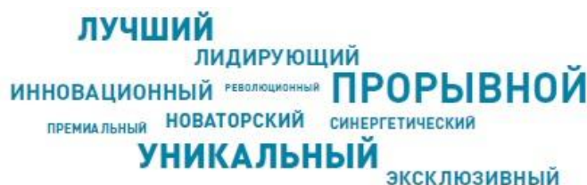
Рис. 9. Вредные прилагательные