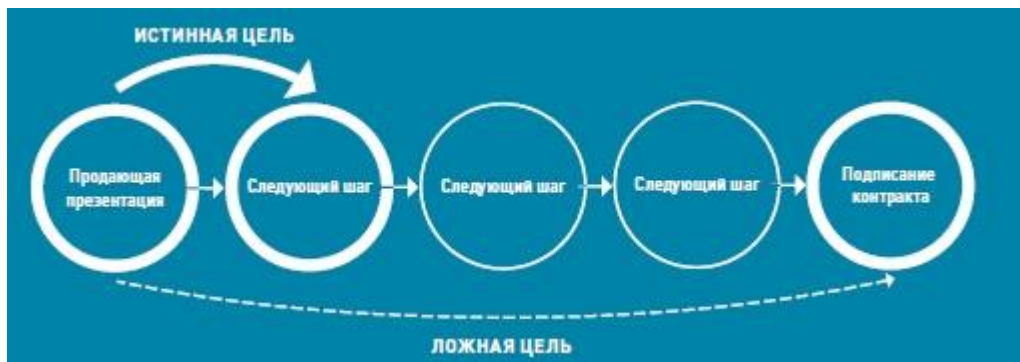
Рис. 1. Цель корпоративной презентации

Как оценить, достигли мы цели или нет? Обратите внимание, что говорят вам клиенты после презентации (рис. 2).