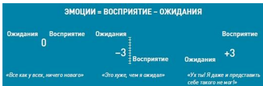
Рис. 5. Превзойдите ожидания клиента

Часто потенциальные клиенты не в состоянии моментально оценить качество продукта. И тогда они судят по атрибутам. Качество презентации – зримый атрибут работы вашей компании. Посмотрите на выбор поставщика глазами клиента. Вы находите трех поставщиков, встречаетесь с ними. Сравниваете их предложения. И приходите к выводу, что нет никакой разницы в том, что они предлагают. Все одинаково. Все опции одинаковы. На основании чего делать выбор? На самом деле разница всегда есть — она в людях и в их отношении. Скорее всего, вы выберете того, кто вам больше понравится. Того, кто, на ваш взгляд, будет прикладывать больше усилий. Того, с кем вы будете чувствовать себя в безопасности (рис. 5).