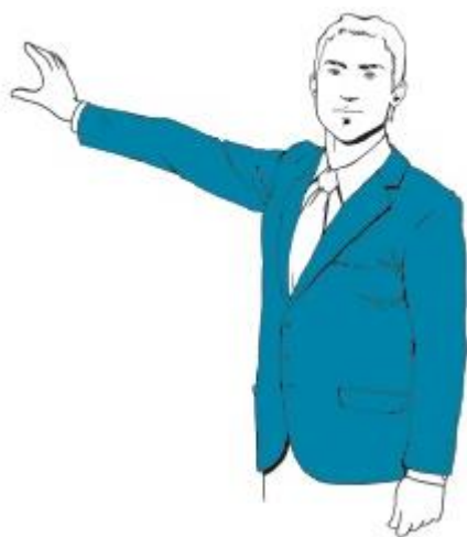
Рис. 12. «Клешня» — наиболее универсальный жест

Жесты — не менее важный вспомогательный инструмент презентации, чем слайды. В качестве базовой позиции между жестами и перемещениями используйте позу «руки по бокам». «Клешня» — наиболее универсальный жест (рис. 12). Рассказывающие о погоде теледикторы показывают «клешней» на экран, повернувшись корпусом к камере. Вы можете использовать этот жест, показывая что-то на слайдах или на флипчарте, — и одновременно поддерживать зрительный контакт, повернувшись к аудитории.