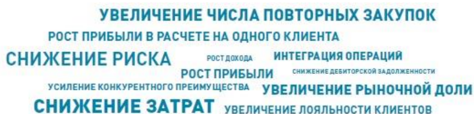
Рис. 8. Нежелательные штампы

Декларирующий подход. Не используйте затертые слова (рис. 8), оценочные прилагательные (рис. 9), птичий язык (для посвященных). Не перегружайте презентацию фактами.