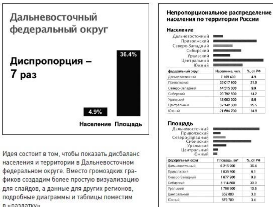
Рис. 11. Слайд для презентации и информация для печатного документа

Впервые термин «слайдомент» применил Гарр Рейнолдс в своем блоге, посвященном презентациям (подробнее см. Гарр Рейнольдс. Презентация в стиле дзен ). Авторы презентаций оказываются перед выбором: создать слайды, поддерживающие живое выступление, или же слайды, похожие на документы, чтобы использовать в качестве раздаточных материалов до, во время и после встречи. Главная ошибка в таком случае — пытаться сделать слайды, которые подойдут сразу для всего. Слайдомент — печатный документ, превращенный в слайд и проецируемый на экран. Готовя презентацию, создавайте по отдельности слайды и печатные документы для раздачи участникам встречи (рис. 11).