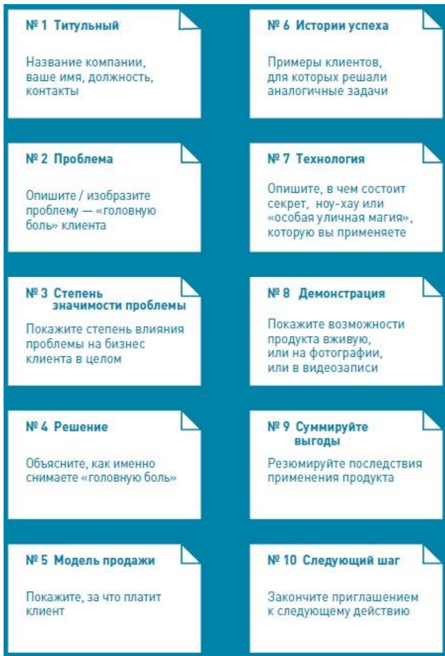
Рис. 6. Структура продающей корпоративной презентации

С чего начать подготовку к презентации? Устройте мозговой штурм. Частая ошибка — готовить презентацию сразу на компьютере. В таком случае очень много времени уходит на технические моменты: сохранение файлов, изменение размера шрифта и цвета линий. Поэтому, если нужно сгенерировать как можно больше идей, лучше выключить компьютер и взять в руки карандаш и стикеры. Готовьте два варианта слайдов: для печати и раздачи участникам встречи (больше текста) и для проецирования на экран (больше картинок).