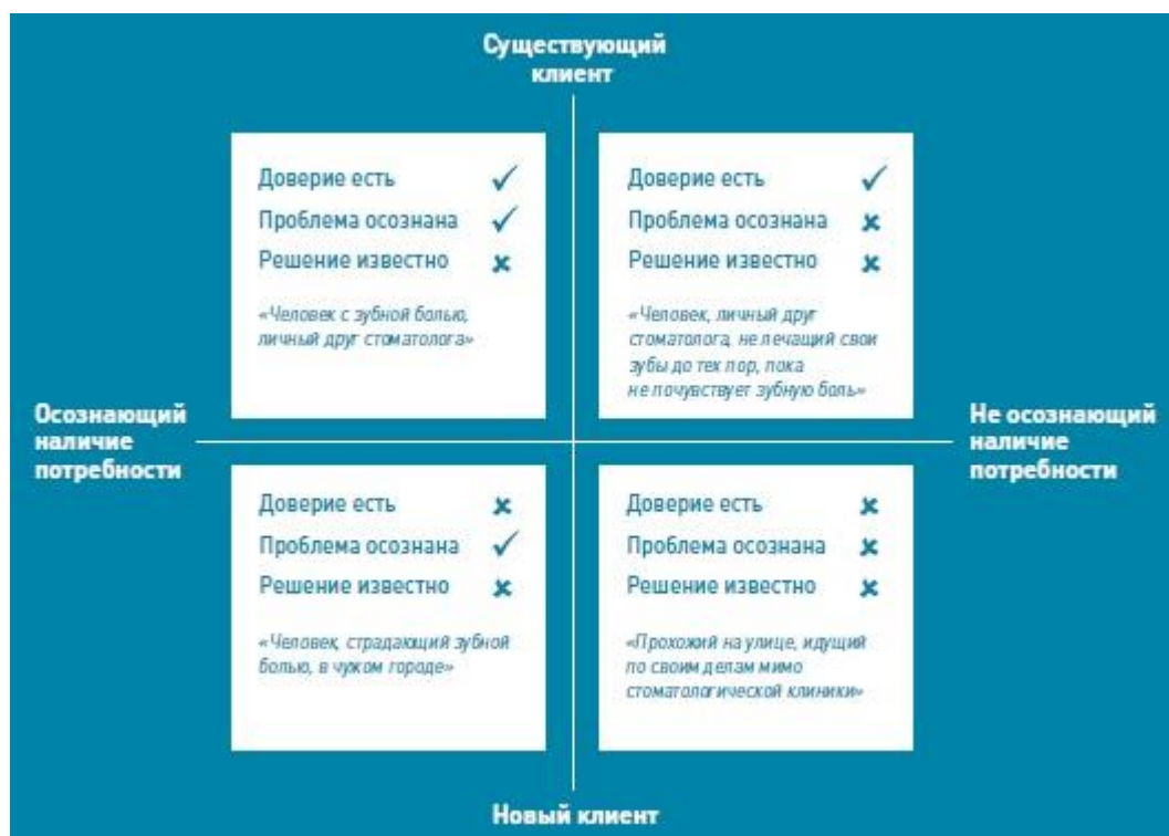
Рис. 3. Матрица «тип клиента – осознание потребности»

Прежде чем приступать к разработке продающей презентации для корпоративного клиента, ответьте на два простых вопроса. Сотрудничаете ли вы уже с этим клиентом? Осознает ли клиент потребность в продуктах или услугах, которые вы продаете (рис. 3)?