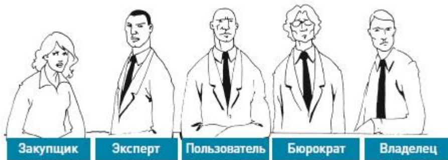
Рис. 10. Пять действующих лиц, участвующих в принятии решений