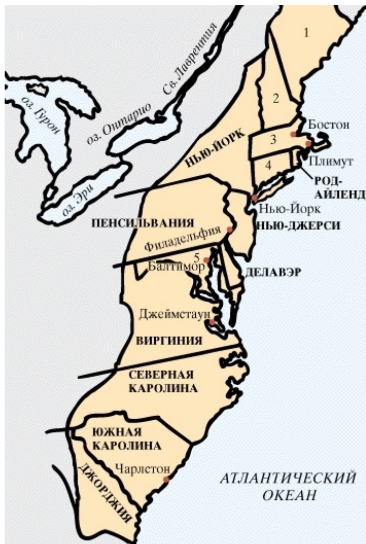
Рис. 1. Тринадцать североамериканских колоний , 1750: 1 – территория Массачусетса, 2 – Нью-Гэмпшир, 3 – Массачусетс, 4 – Коннектикут, 5 – Мэриленд

В большинстве штатов, расположенных на юго-западе от Гудзона (на рис. 1 ниже Нью-Йорка), поселились богатые землевладельцы. Они принесли с собой аристократические принципы и вместе с ними — английские законы о наследовании. Землевладельцы представляли собой высшее сословие, которому были свойственны особые убеждения и пристрастия и которое становилось в центре политической жизни общества.