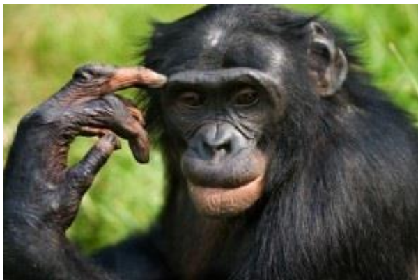
Рис. 1. Бонобо или карликовый шимпанзе

Сергей Сергеевич Четверикова (1880–1959) показал, что природные популяции несут в себе огромный запас ранее произошедших мутаций. Так что отбору всегда есть с чем работать. Представления очень многих людей о естественном отборе до сих пор грешат самым вульгарным ламаркизмом. Спросите человека на улице, какой щенок скорее выучится трюкам на манеже — несчастная дворняга или счастливчик из династии цирковых псов? Наверняка вам ответят: конечно, цирковой — ведь все его предки работали на манеже; разве могли не закрепиться в генах столь важные признаки? А ведь человек учил в школе, что приобретенные признаки не наследуются. Между прочим, когда журналисты пишут о лениости российского мужика, они оперируют в точности таким же поверхностно понятым эволюционизмом.