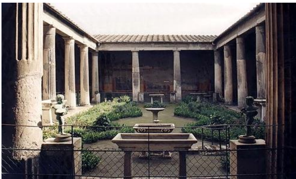
Рис. 2. Перистиль ( внутренний дворик )

Широкий диапазон видов деятельности, связанных в римском обществе со сферой частного, обуславливает возникновение сложной архитектурной рамки, для которой характерны, в частности, две черты: специализация разных помещений и забота о поддержании необходимой связи этих помещений между собой. Важная роль отводится перистилям (рис. 2) — как в архитектурной композиции, так и в общей структуре дома: множество задач, которые они берут на себя, всего лишь отражает общее разнообразие функций жилого комплекса. Эти дворы с колоннадами являются главной отличительной чертой богатых домовладений. Дополненные коридорами и прихожими, они весьма эффективно содействуют разрешению проблемы, на первый взгляд неразрешимой: создавать однородное пространство, в котором без особых проблем могли бы осуществляться столь разные виды деятельности.