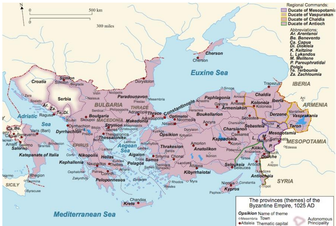
Рис. 3. Византийская империя в 1025 г.

В 867 году император Михаил III был убит своим фаворитом и соправителем Василием, происхождение которого не ясно до сих пор. Василий стал основателем новой династии, правившей вплоть до 1056 года — года смерти Феодоры, последней ее представительницы.