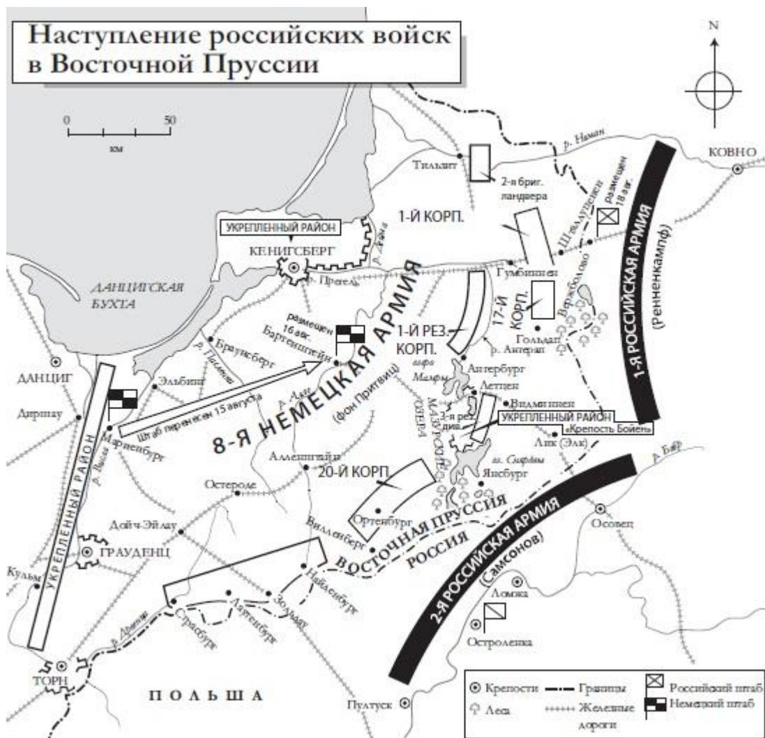
Рис. 5. Наступление российских войск в Восточной Пруссии

У Гумбиннена артиллерия нанесла противнику внушительный урон: российские артиллеристы продемонстрировали высокое мастерство, которое они еще подтвердят в будущих сражениях. Из немецкого строя были выбиты тысячи — каждый четвертый, и многие уцелевшие бежали в панике, не останавливаясь несколько часов. Прусские формирования сильно разметало. Собрать их офицерам удалось с большим трудом лишь к утру. На следующий день немецкое верховное командование испытало череду резких перепадов настроения. Одни высшие офицеры считали, что можно, закрепляя успех предыдущего дня на российских флангах, отбросить армию Ренненкампа, возобновив атаку. Однако Притвиц, потрясенный потерями, и слышать не хотел о таком риске. Мольтке, отправляя его на Восточный фронт, поставил основную задачу — сохранить армию в целости. Поэтому главнокомандующий принял радикальное решение: оторваться от противника и отступить более чем на полторы сотни километров к западу, в сторону Вислы.