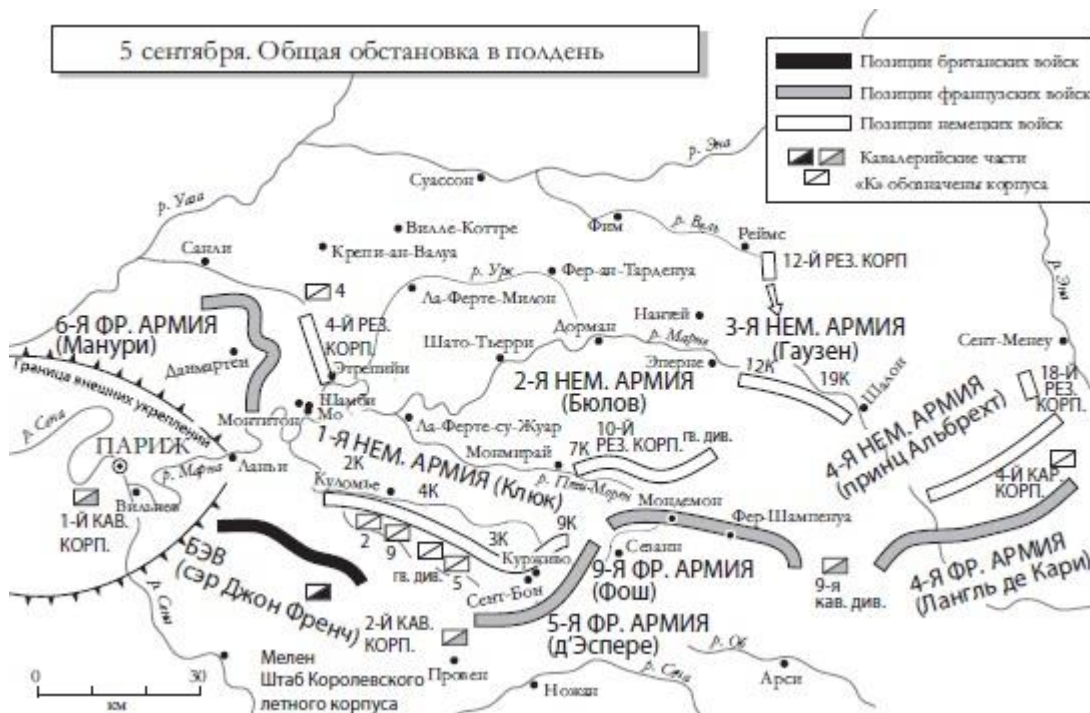
Рис. 6. Битва на Марне, 5-10 сентября 1914 г.

Прежде чем начинать масштабное наступление на западе или в принципе вступать в войну, немцам следовало бы поразмыслить над тем, как редки в истории примеры быстрого разрешения конфликтов между приблизительно равными по силе соперниками. Армии 1914 года имели все необходимое, чтобы наносить сокрушительный урон живой и материальной силе противника, однако транспортные технологии и связь значительно отставали.