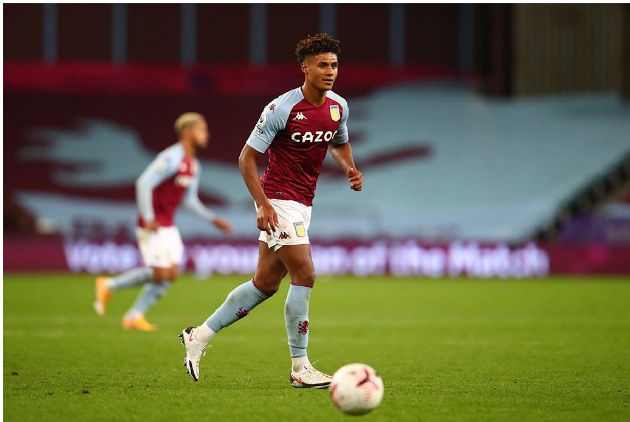
Рис. 4. Олли Уоткинс дает гибкость в качестве форварда средней ценовой категории

Если вы выбираете игроков, уникальных в своем ценовом уровне, убедитесь, что все они достойны места в вашей команде. В противном случае потратьте деньги на игроков в таких ценовых диапазонах, где у вас будет больше гибкости.