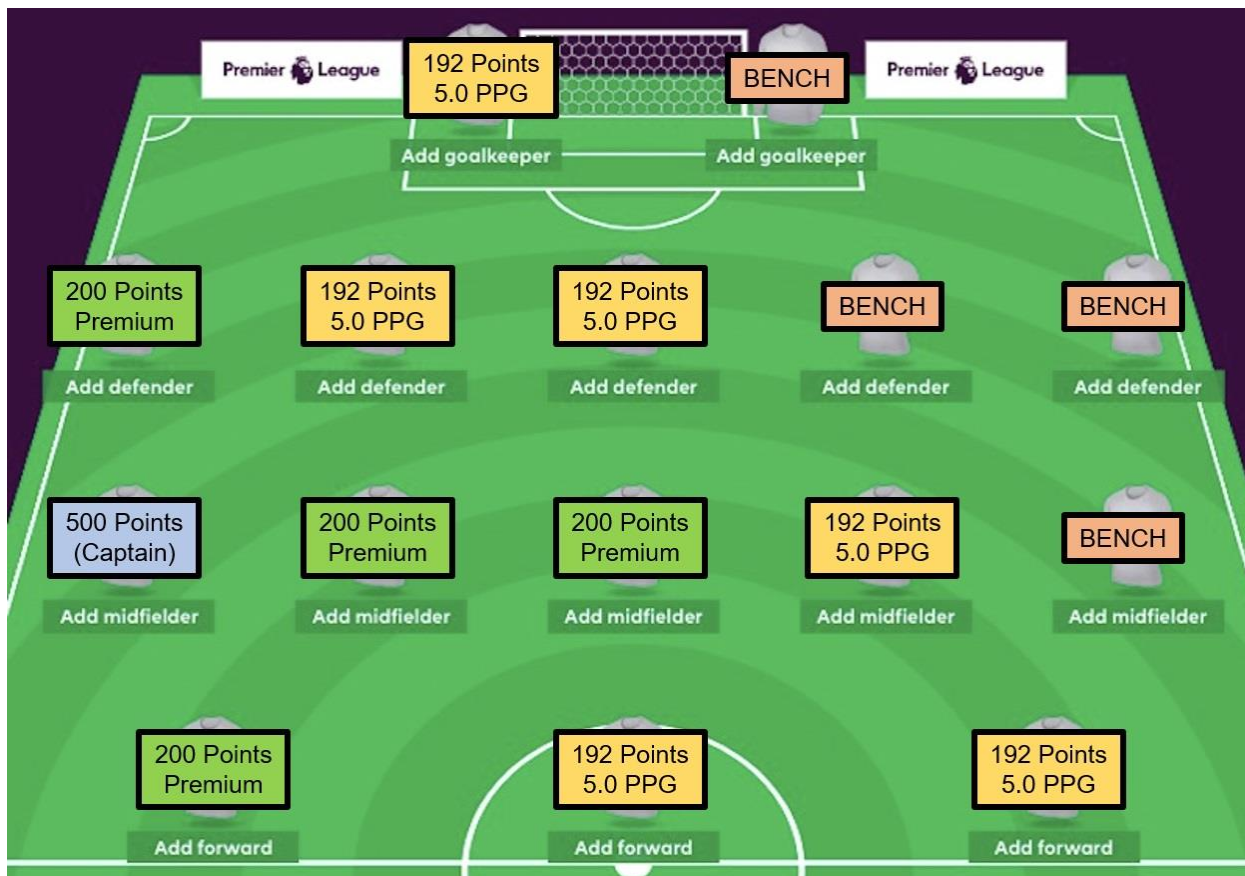
Рис. 3. Блокируем премиальных игроков