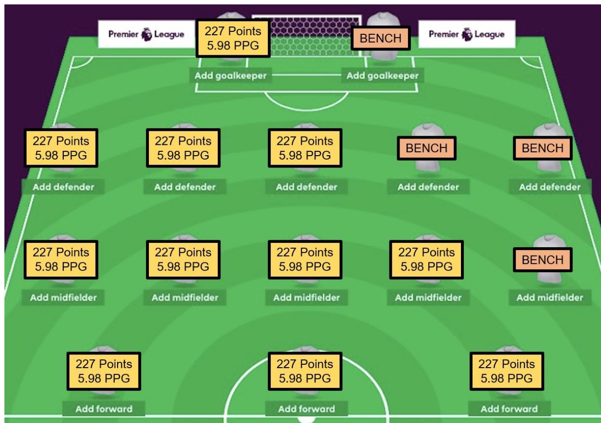
Рис. 1. Чистый лист – стартовый выбор игроков

Что нужно, чтобы выиграть Fantasy Premier League (FPL)? Набрать за сезон около 2500 очков. Сумма очень большая. Но я предложу простую стратегию, разбив эти 2500 пунктов на отдельные достижимые цели. Я надеюсь, что мои предложения позволят менеджерам FPL сохранять терпение и концентрацию на протяжении всего сезона. 1