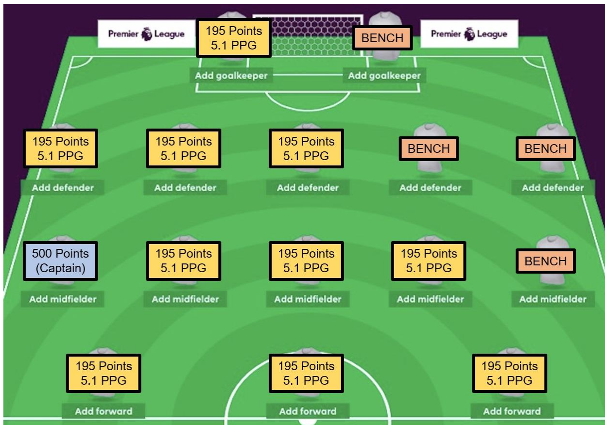
Рис. 2. Учет капитана и фишки

195 очков – вполне достижимая сумма. В сезоне 18/19 ее превысили семь игроков (плюс лидер) а в сезоне 19/20 – восемь. Правда в сезоне 20/21 только трое (плюс лидер) достигли этой цели. И все они были с премиальным ценником (еще Бэмфорд набрал 194 очка).