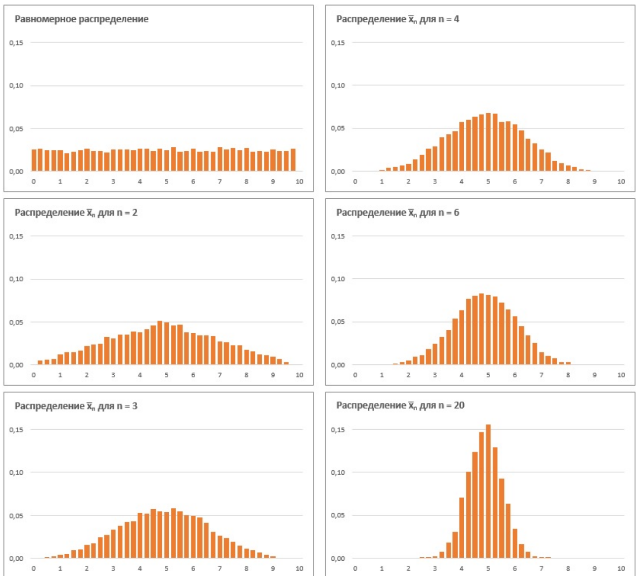
Рис. 1. Равномерное распределение случайной величины и распределение средних значений выборок разного размера

Если и эта формулировка мало что вам прояснила, не отчаивайтесь, изучите два примера.