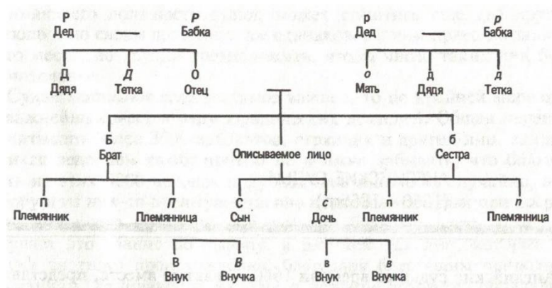
Рис. 3. Система знаков родственников

Система яснее видна из следующей таблицы: